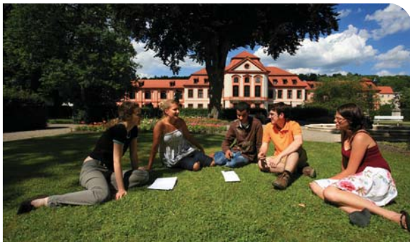
Der Eichstätter Hofgarten – das „grüne Wohnzimmer“ der KU

Seit 2001 führt die Universität den Namen „Katholische Universität Eichstätt-Ingolstadt“, denn neben den sieben in Eichstätt angesiedelten Fakultäten wurde 1989 am ältesten bayerischen Universitätsstandort die Wirtschaftswissenschaftlichen Fakultät Ingolstadt gegründet, an der inzwischen fast jeder vierte Studierende der KU eingeschrieben ist.