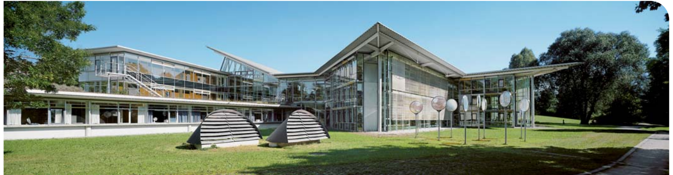
Die lichtdurchflutete Zentralbibliothek wurde von Stararchitekt Günther Behnisch direkt neben dem Eichstätter Campus in die Altmühlau integriert.

Die KU ist an beiden Standorten eine Campus-Universität der kurzen Wege: Mensa, Hörsäle, Bibliothek und Rechenzentrum liegen nur wenige Minuten Fußweg voneinander entfernt. Drangvolle Enge ist an der KU unbekannt: Nicht selten haben Seminare weniger als zwanzig Teilnehmer, auch die Vorlesungen sind keine Massenveranstaltungen. Die rund 4500 Studierenden werden von 120 Professoren, mehr als 200 wissenschaftlichen Mitarbeitern und zahlreichen Dozenten aus der Praxis betreut. Zudem erleichtert die gute Ausstattung von Bibliothek und Rechenzentrum das Studieren. Dazu gehören zum Beispiel neun Pools mit insgesamt 150 PCs, aber auch das campusweite, drahtlose Hochschulnetz zum bequemen Einwählen mit dem Notebook in das Uni-Netz. Die Universitätsbibliothek bietet 1,7 Millionen Bände, 7.100 laufende Zeitschriften, 430.000 weitere Medien (Tonträger, Filme o.ä.) sowie 340 Datenbanken. Die Literaturrecherche sowie die Bestellung sind an jedem PC mit Internetzugang möglich.